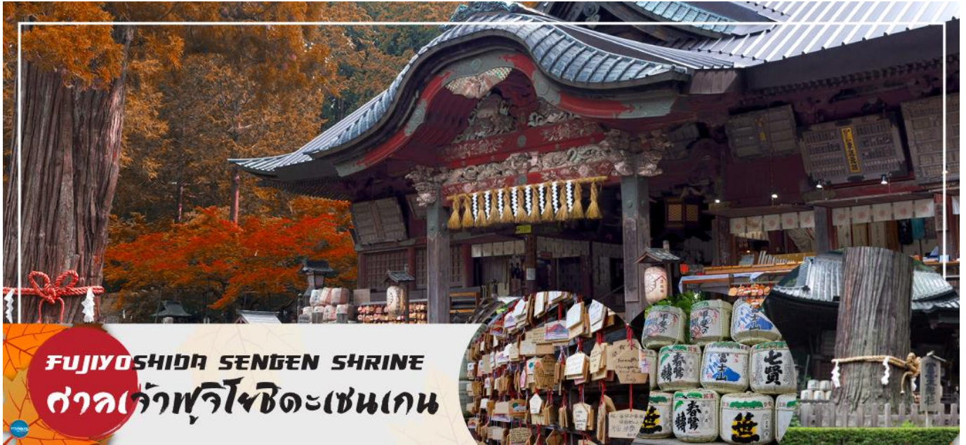
FUJIYOSHIDA SENGEN SHRINE ศาลเจ้าฟูจิโยชิเดเซนเกน

เมืองยามานาชิ – ศาลเจ้าฟูจิโยชิเดเซนเกน – พิธีชงชาญี่ปุ่น – กรุงโตเกียว – ชมแมวยักษ์ 3 มิติ พร้อมช้อปปิ้ง ย่านชินจูกุ – เมืองนาริตะ