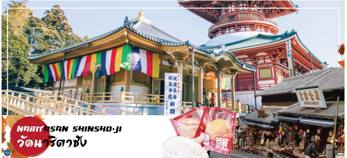
NARITASAN SHINSHO-JI วัดนาริตาชิน

วันที่หก เมืองนาริตะ – วัดนาริตะชิน – ถนนโอมโตะซังโตะ – ย่านโอดะบะ – ห้างไดเวอร์ซิตี – ท่าอากาศยานนานาชาตินาริตะ – ท่าอากาศยานสุวรรณภูมิ