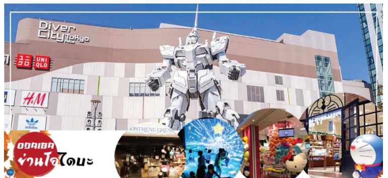
อภิมหานคร ย่านโอดะบะ

บันเทิงต่างๆ ในอ่าวโตเกียว ได้รับการปรับปรุงให้มีชื่อเสียงและเป็นที่ยอมรับในช่วงหลังของปี 1990 นอกจากนี้มีสถาปัตยกรรมที่สวยงามตั้งอยู่มากมายแล้ว แต่ก็ยังคงความเป็นธรรมชาติไว้ด้วยความอุดมสมบูรณ์ของพื้นที่สีเขียว ไดเวอร์ซิตี โตเกียว พลาซ่า (Diver City Tokyo Plaza) เป็นห้างดังอีกห้างหนึ่ง ที่อยู่บนเกาะ โอดะบะ จุดเด่นของห้างนี้ก็คือ หุ่นยนต์กันดั้ม ขนาดเท่าของจริง ซึ่งมีขนาดใหญ่มาก ในบริเวณห้าง อีสรระช้อปปิ้งตามอัธยาศัย