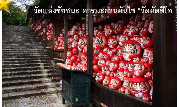
วัดแห่งชัยชนะ ดารุมะย่านคันไซ “วัดคัตสึโฮจิ