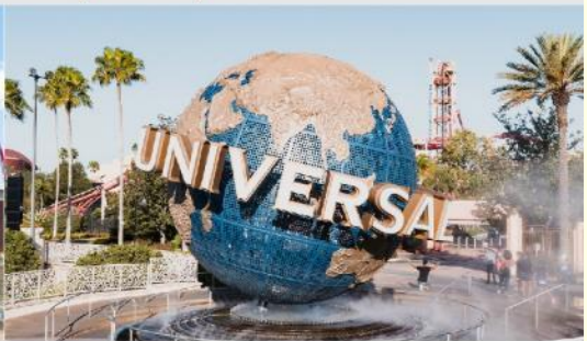
ยูนิเวอร์เซล ปักกิ่ง รีสอร์ท